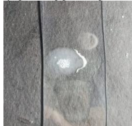
Gambar 3. Hasil uji katalase

munculnya gelembung-gelembung dan oksigen.