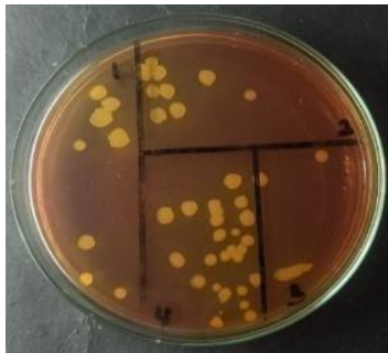
Gambar 1. Hasil uji bakteri S. aureus pada cawan petri

Identifikasi S. aureus dengan cawan gores. Terbentuknya koloni bakteri berwarna kuning, bulat, dan cembung pada media Mannitol Salt Agar (MSA), hasil pengujian menunjukkan bahwa bakteri tersebut sebenarnya adalah Staphylococcus aureus ATCC 25923. Kemampuan bakteri untuk memfermentasi manitol inilah yang menyebabkan koloni tersebut berubah menjadi kuning.