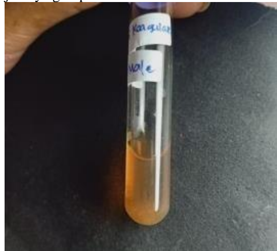
Gambar 4. Hasil uji koagulase

Uji koagulase. Produksi gumpalan dalam plasma menunjukkan bahwa bakteri tersebut sebenarnya adalah Staphylococcus aureus ATCC 25923, menurut hasil identifikasi. Enzim koagulase dalam plasma EDTA bereaksi untuk mengubah fibrinogen menjadi fibrin, yang menyebabkan terjadinya gumpalan ini.