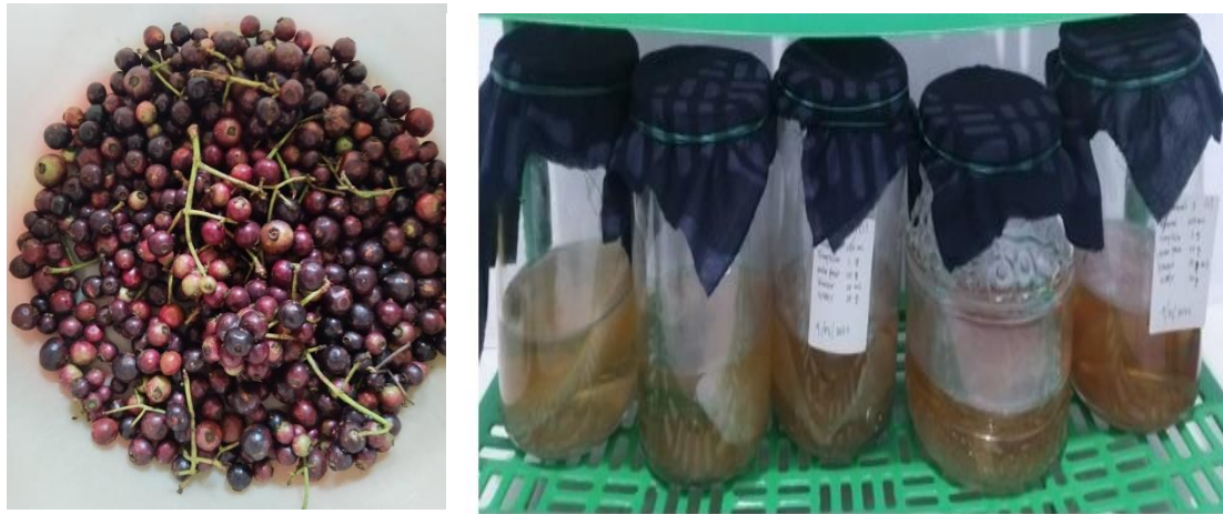
Gambar 1. Kombucha Kupa